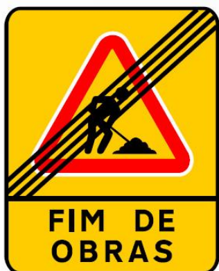
ST14 – FIM DE OBRAS