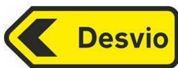
TV4 – DESVIO ESQUERDA