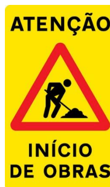
Sinal de trânsito provisório, perigo, início obras