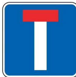
H4 – VIA SEM SAIDA