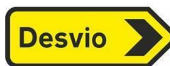
TV4 – DESVIO DIREITA